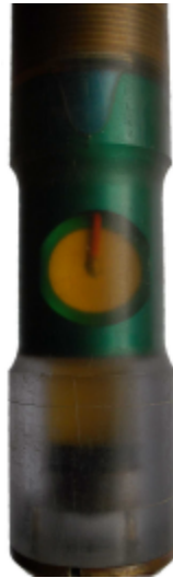
Fig. 1 Capteur ultrason rotatif du scanneur de forage au bain d'huile

La résolution radiale du scanneur acoustique dépend du balayage de la paroi du forage et du diamètre du forage. La résolution en direction de l'axe de forage dépend de la vitesse avec laquelle la sonde est agitée dans le forage.